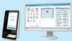
電子処方箋 & オンライン資格確認